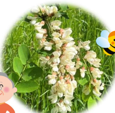
ニセアカシア (ハリエンジュ)