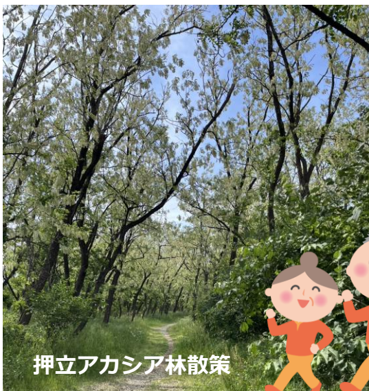
押立アカシア林散策